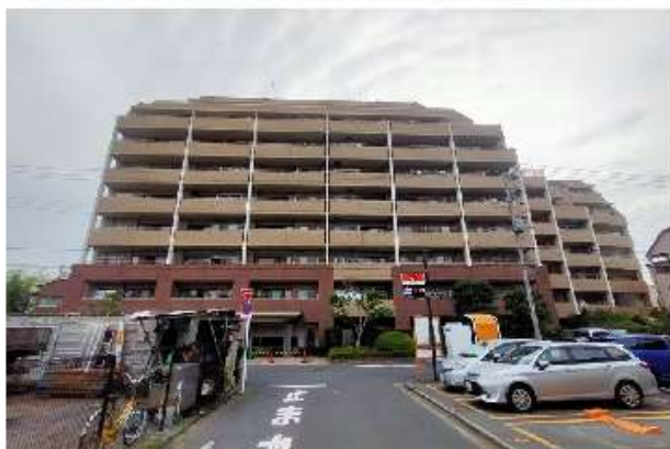
コスモ江戸川クレドムール